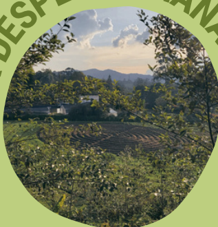
CSA DESPENSA MANANTIAL